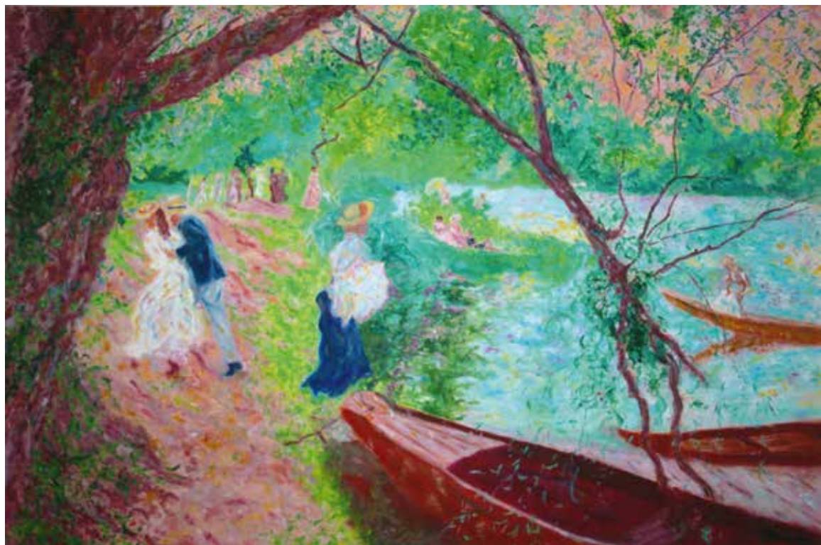
Nicole Beauvallet «Dimanche au bord de l'Oise», 2017 – huile, 97 x 146 cm