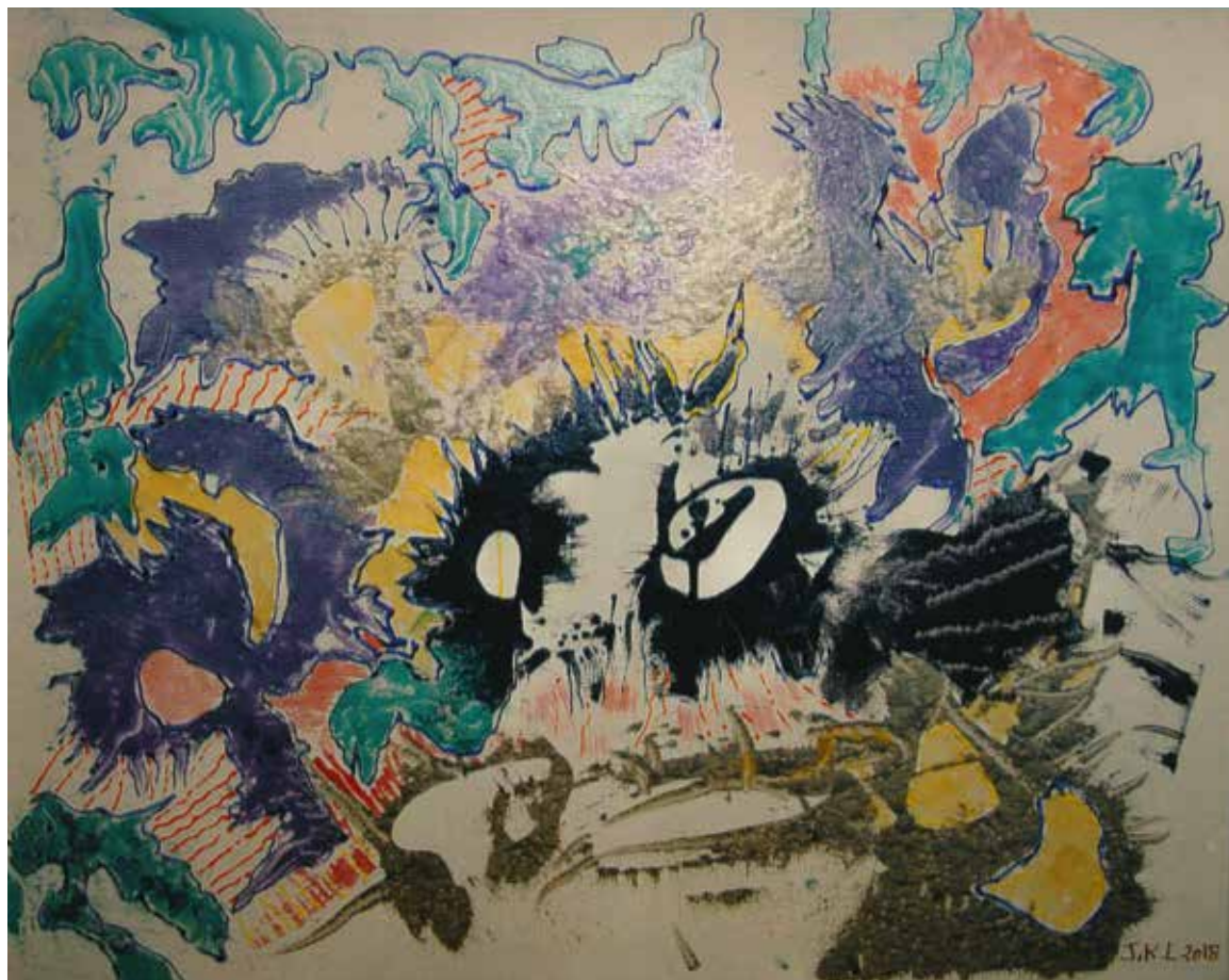
Jocelyne Lamy de la Chapelle, dite J-KGE-LAMY «Jungle», 2018 – acrylique, 54 × 65 cm