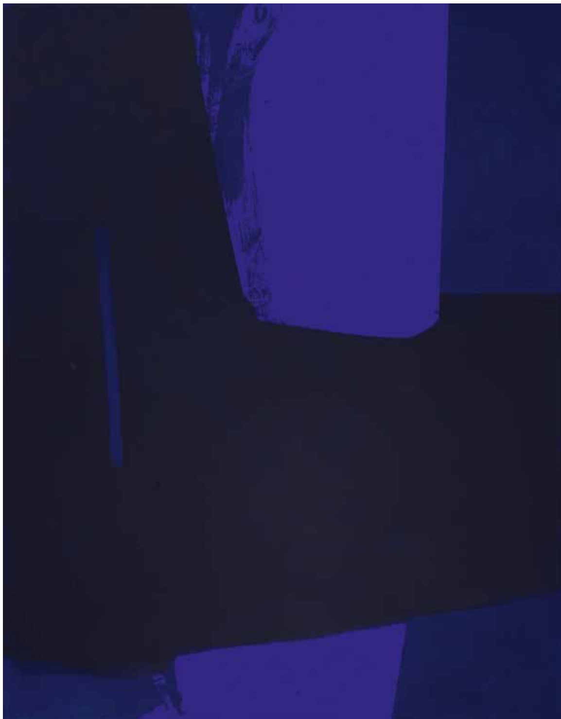
ISTHME «Nuits en mer #13», 2018 – acrylique/toile, 146×114 cm