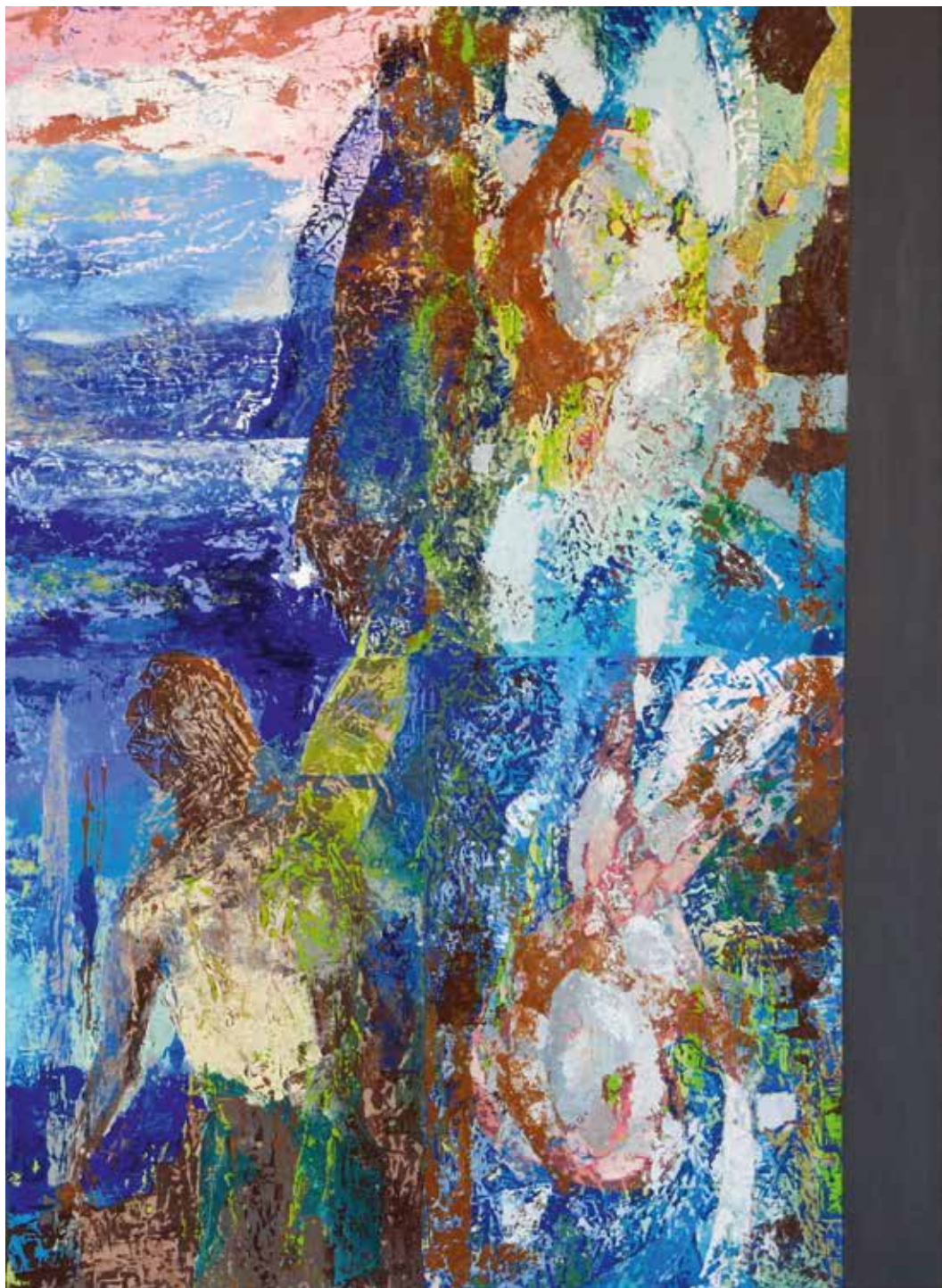
Béatrice Casanova «Les sentinelles», 2017 – huile, 100×70 cm