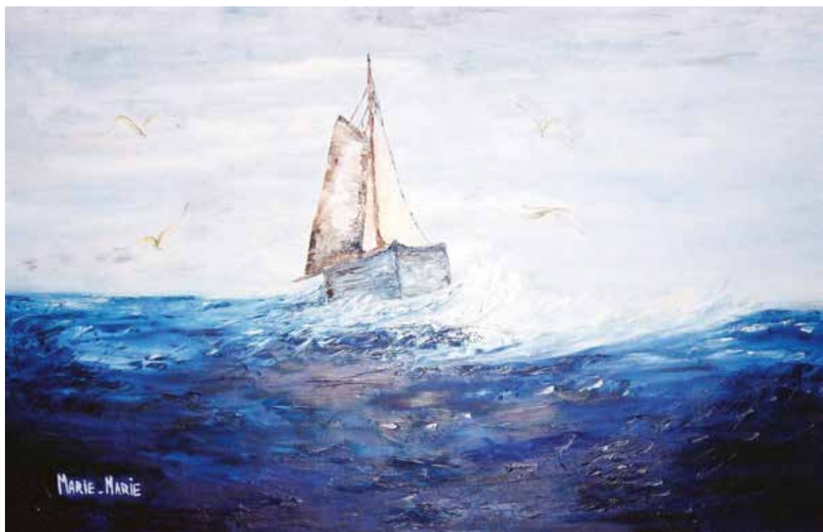
Marie Cochard dite MARIE MARIE « Tempête », 2015 – huile au couteau, 54 x 80 cm