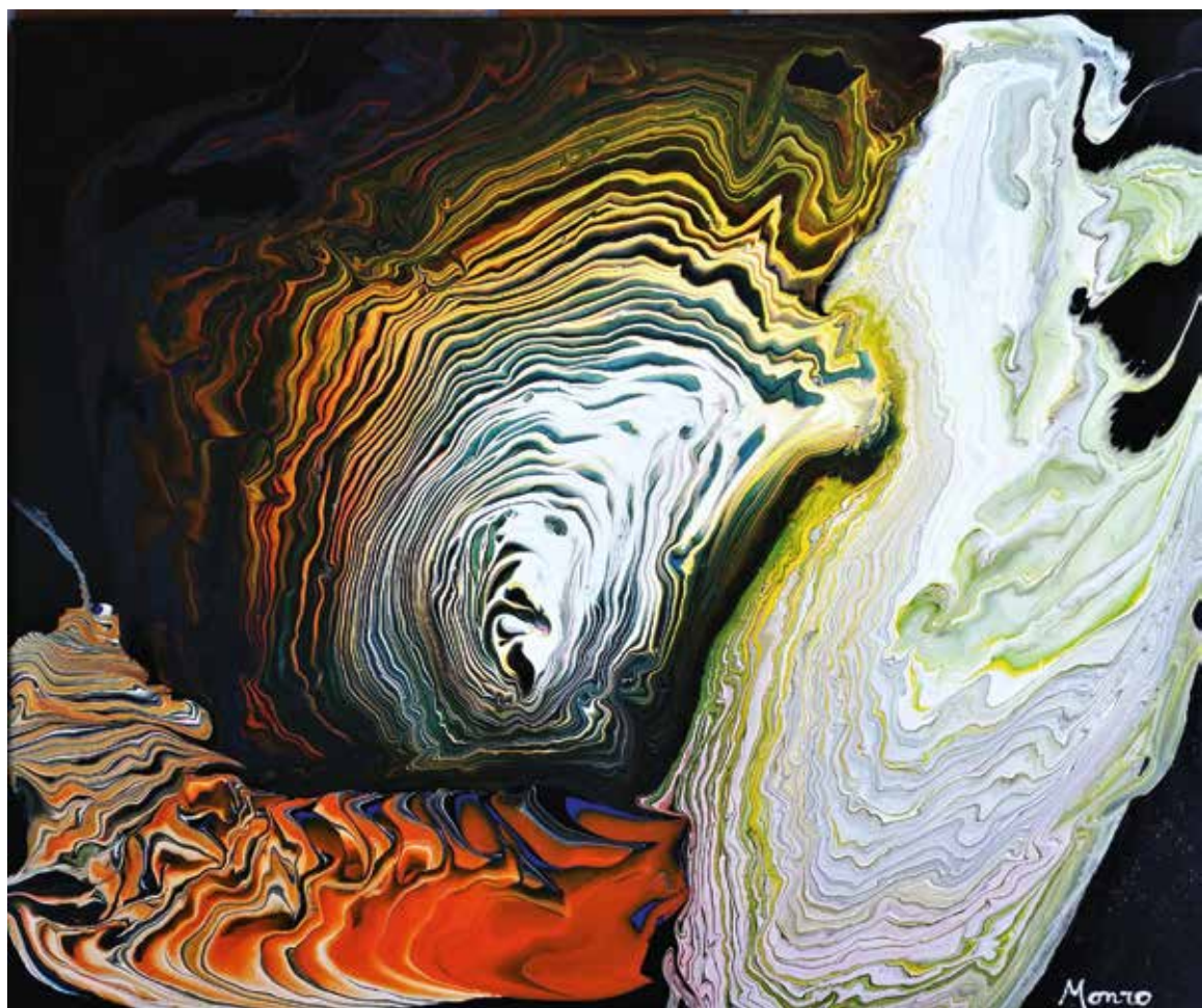
MONRO «Tranches de vie», 2018 – acrylique, 60×50 cm