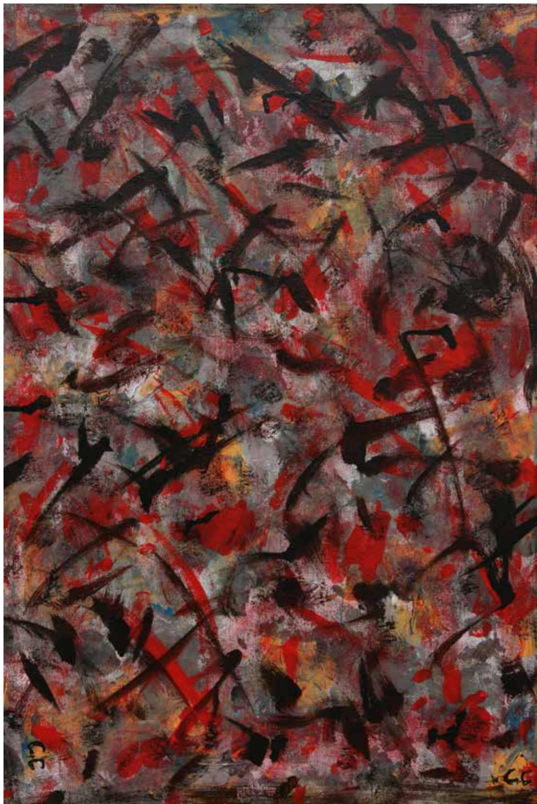
Claude Cailloux «Les oiseaux», 2015 – acrylique, 70×50 cm