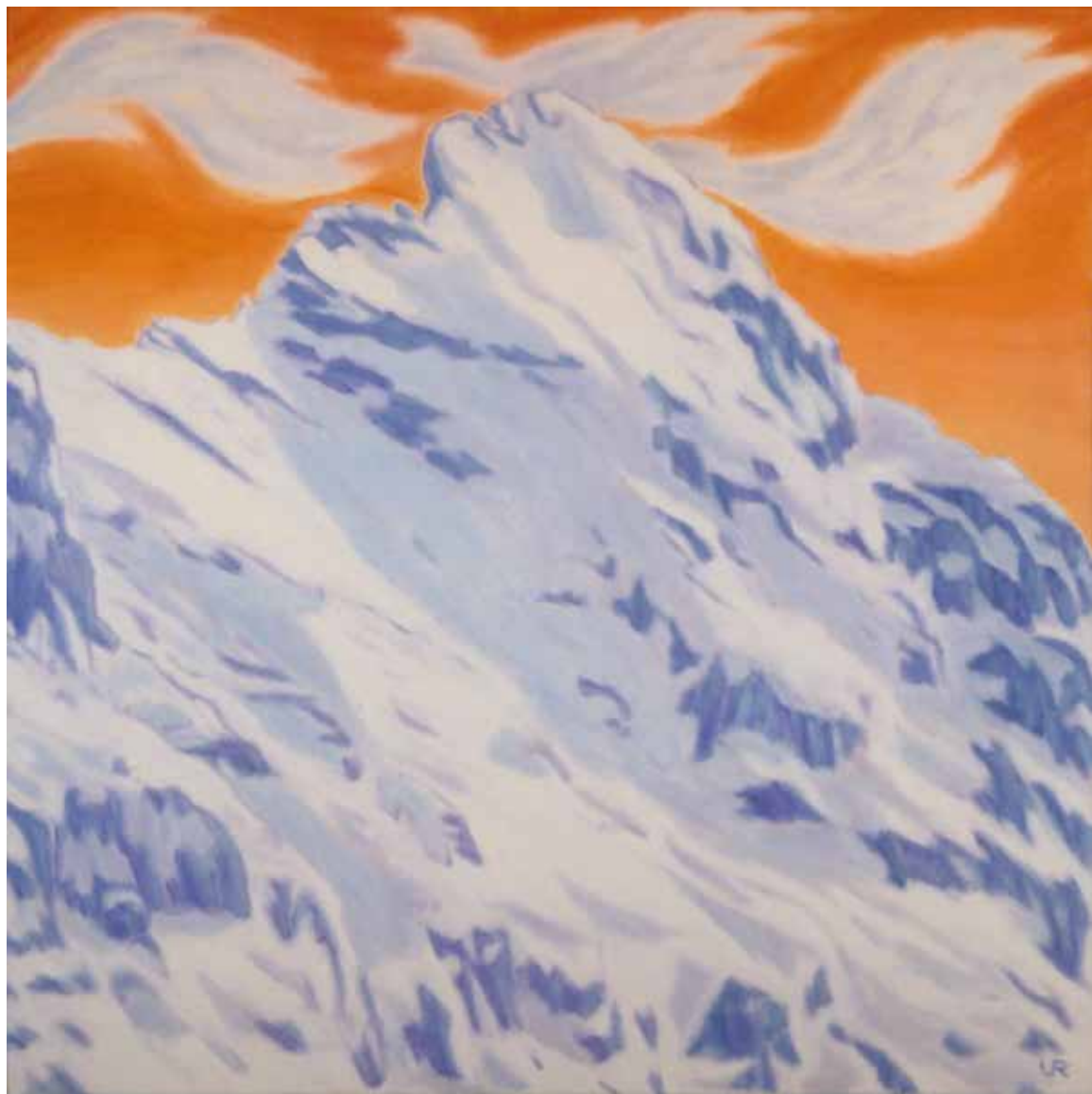
Hansueli Urwyler « Les rêves des nuages de la montagne Eiger, Oberland bernois », 2010 huile, 70 × 70 cm