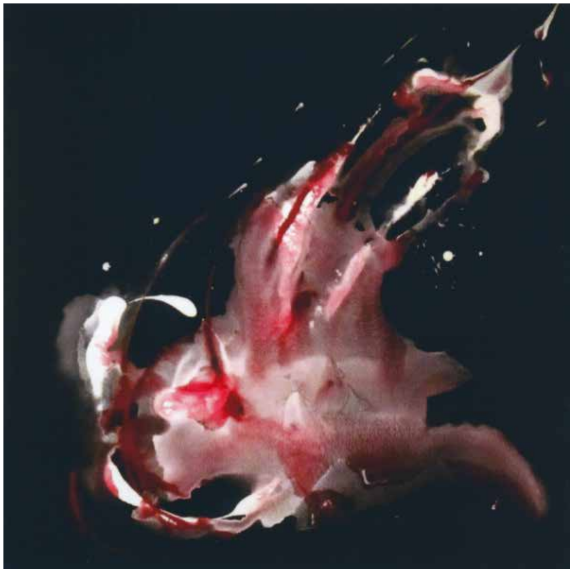
DVORAK «Émergence 2», 2011 – acrylique, 100×100 cm