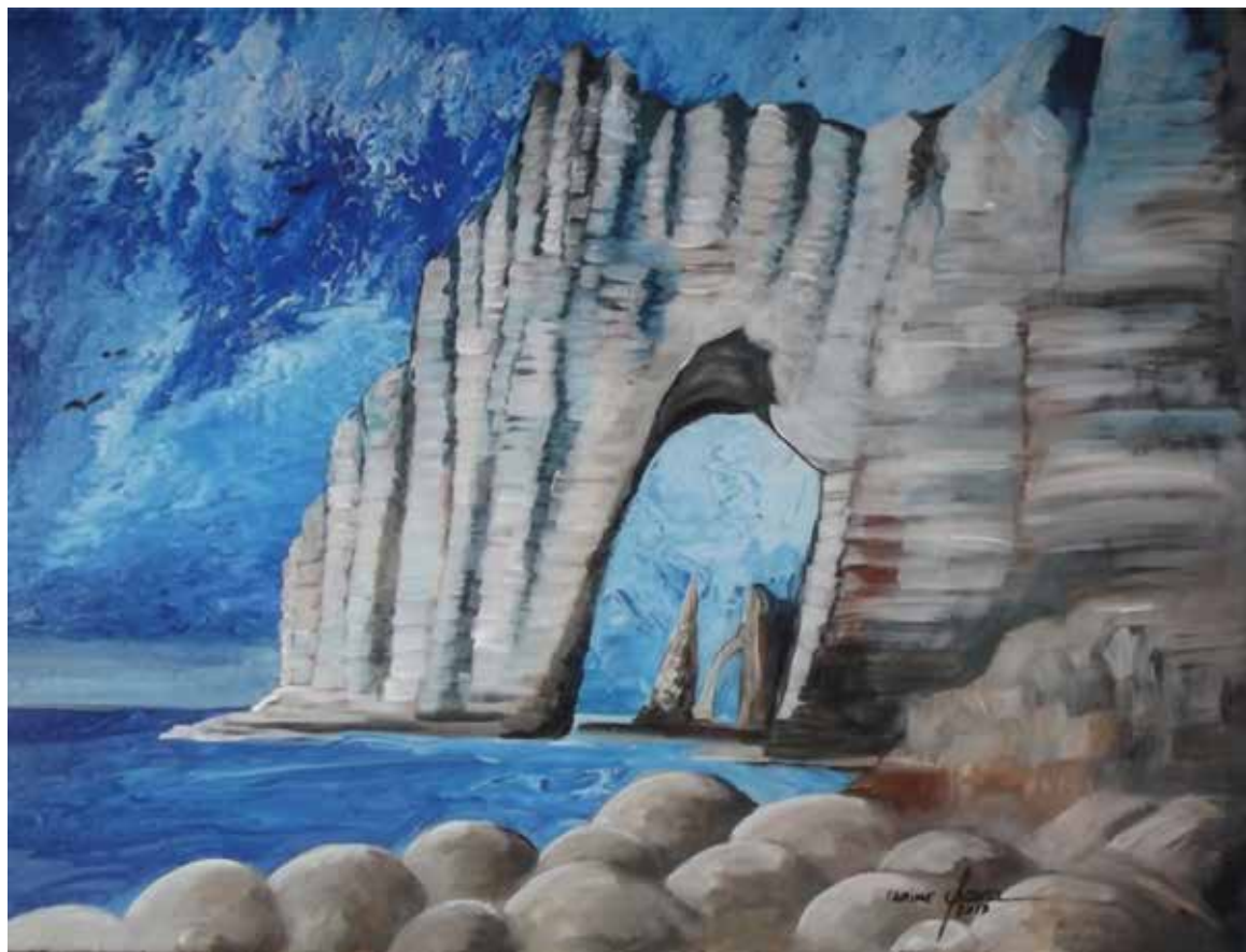
Carine Chever « Les falaises d'Étretat », 2017 – acrylique, 65 × 80 cm