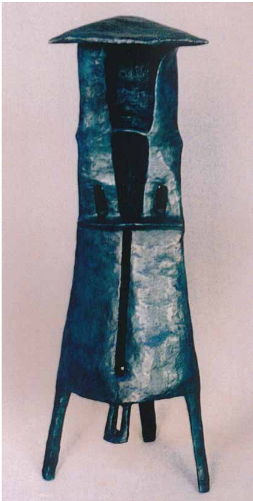
Maki Georgeon «Tripode», 1999 – sculpture/bronze, 44 × 17 × 17 cm