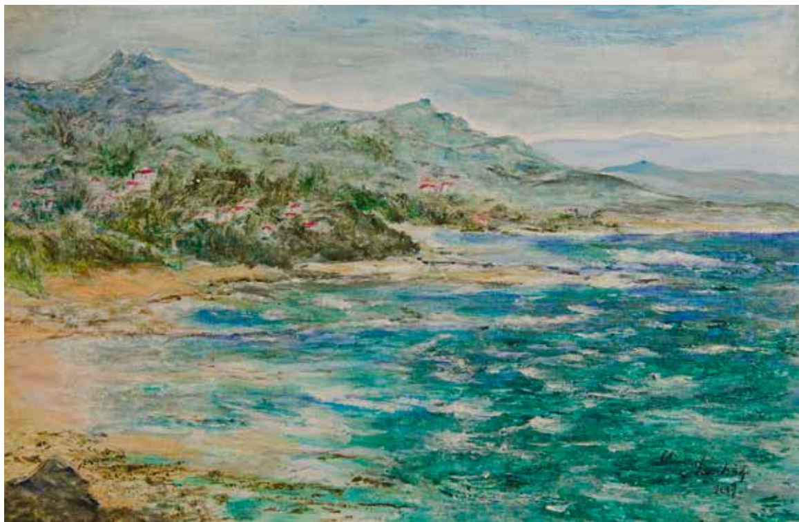
Chantal Lembège «Rivage», 2017 – huile, 40×60 cm