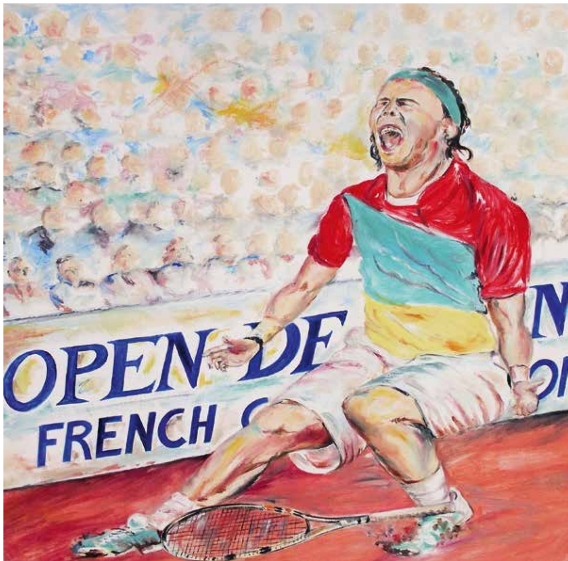
Gérard Jeanton « Le tennisman », 2012 – huile, 80×80 cm