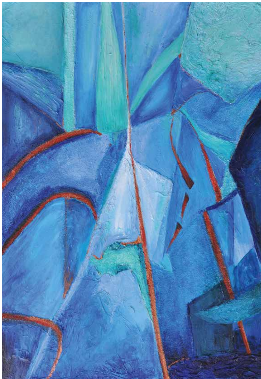
Florence Thibaut « Lâcher prise », 2016 – technique mixte, 100×65 cm.