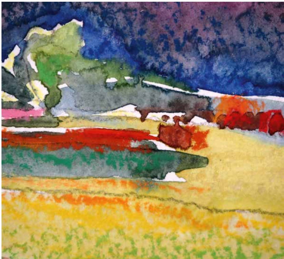
Didier Avenel «Buncrana», 2015 – technique mixte, 61 × 85 cm