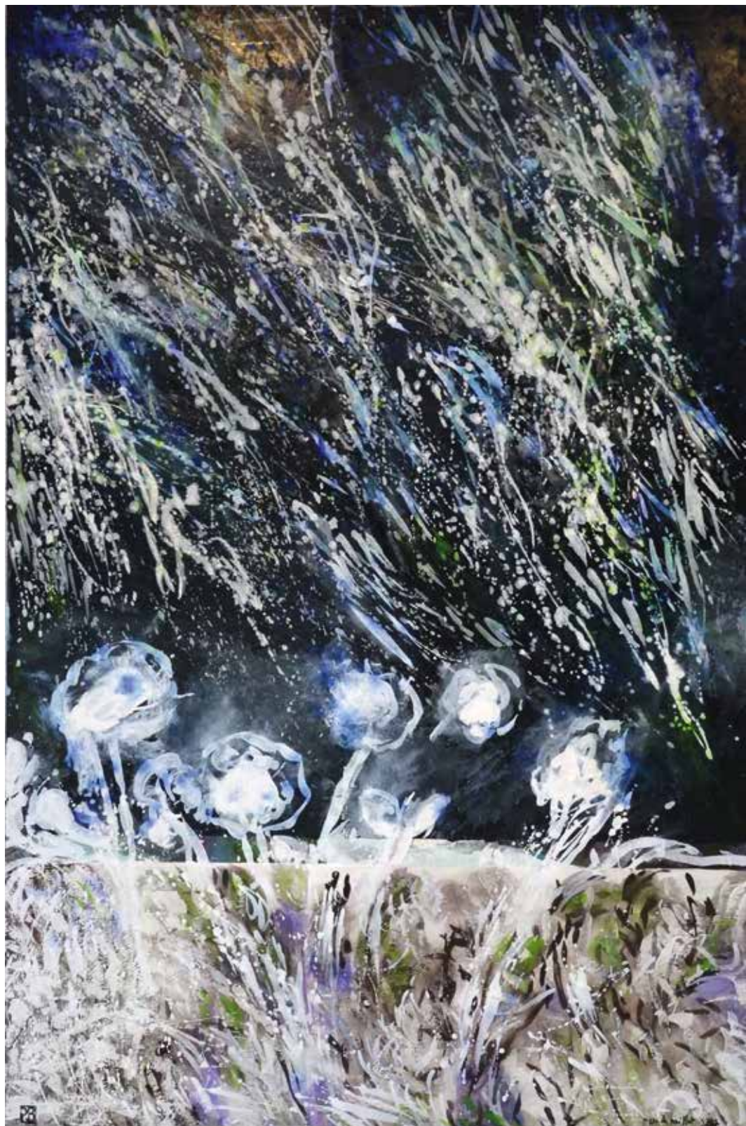
Patrick Baillet « Les Herbes Folles », Hommage à Panait Istrati, 2017 acrylique, pigments, gomme laque/toile, 210 × 140 cm