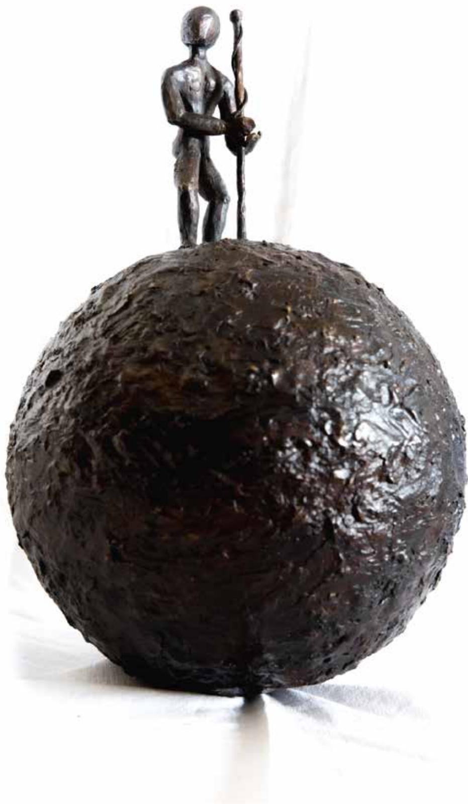
Ophélie Metzquer « L'Homme en marche », 2017 – sculpture/bronze, 48×95 cm