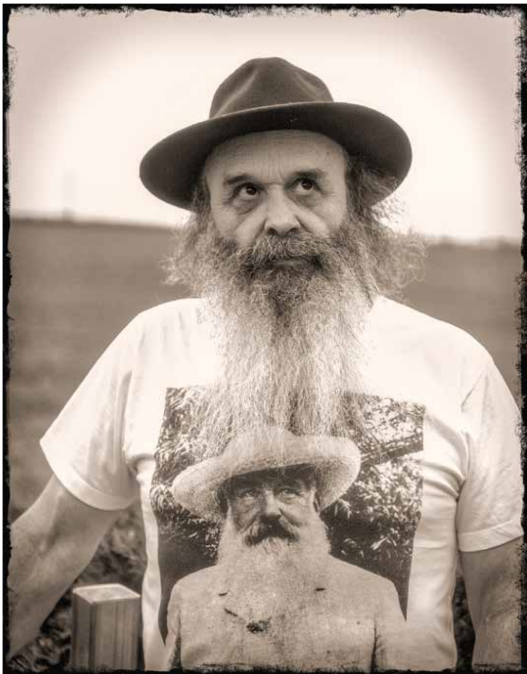
Jean-Daniel Pellet « Autoportrait avec Claude Monet », 2017 – photo sur plaque alu, 35 x 28 cm