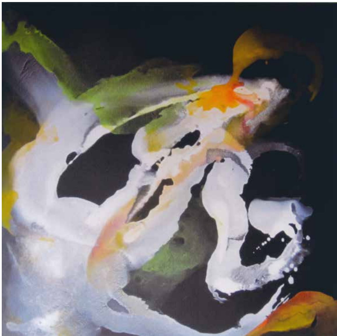
DVORAK «Harmonies», 2011 – acrylique, 100×100 cm