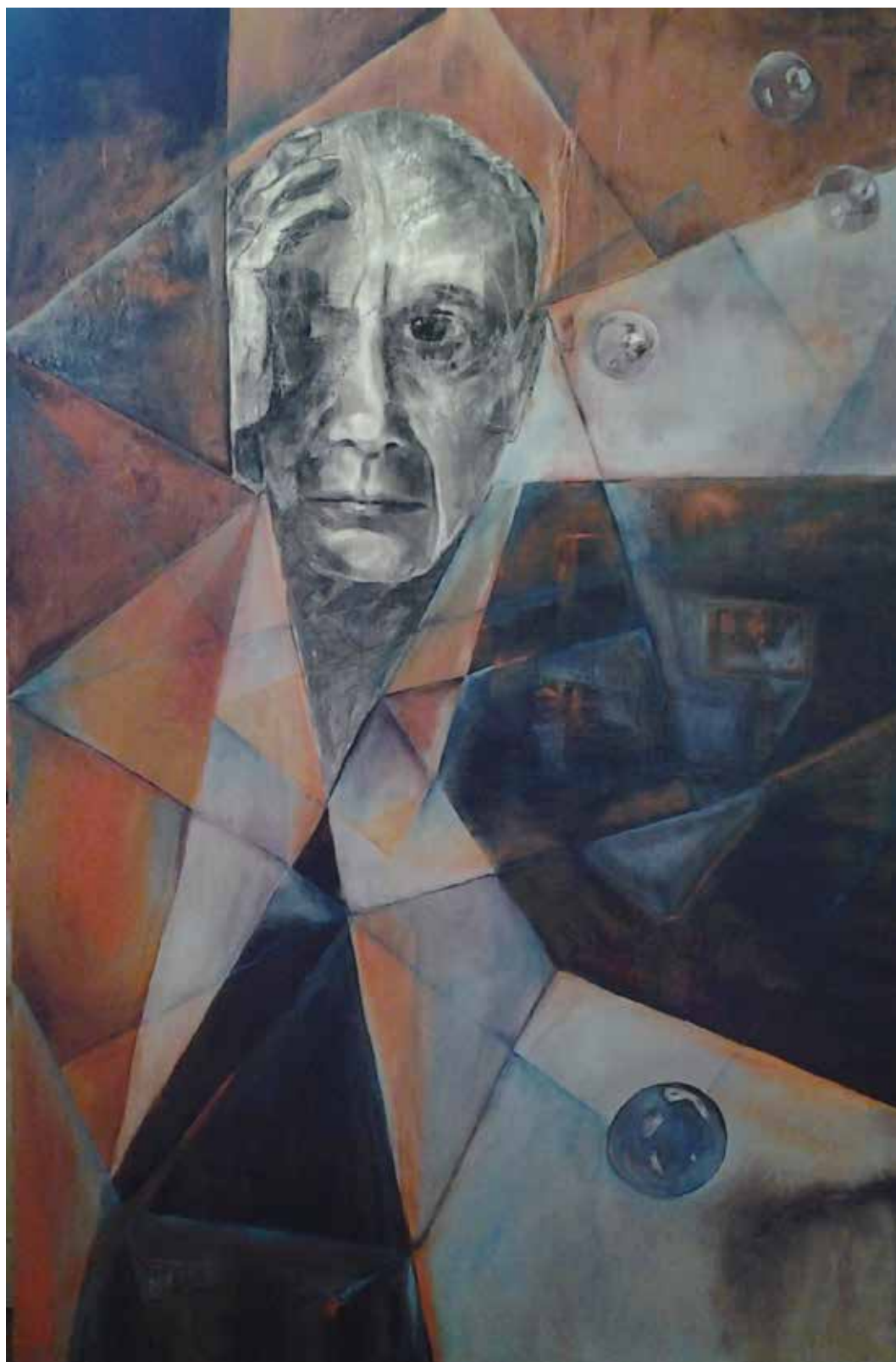
Josiane Beck-Boës «Hommage à Picasso», 2016 – huile/fusain, 195 x 135 cm