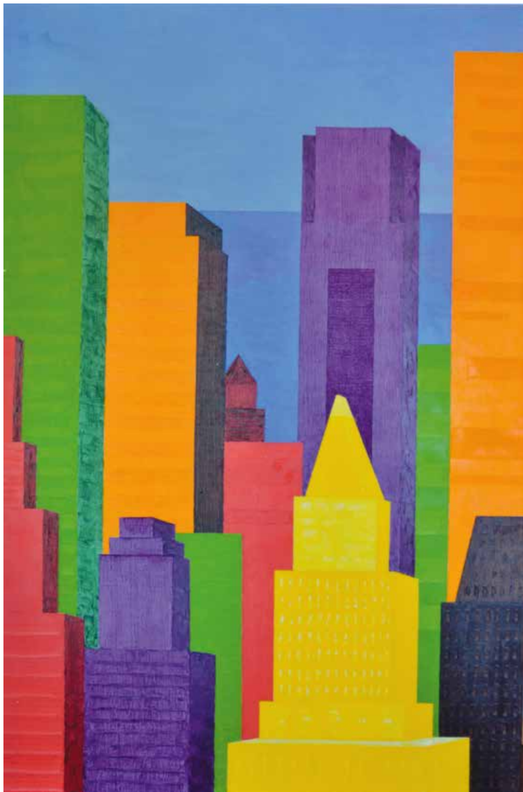
Marc Wangermez «Manhattan the Crown II», 2018 – huile, 130×81 cm