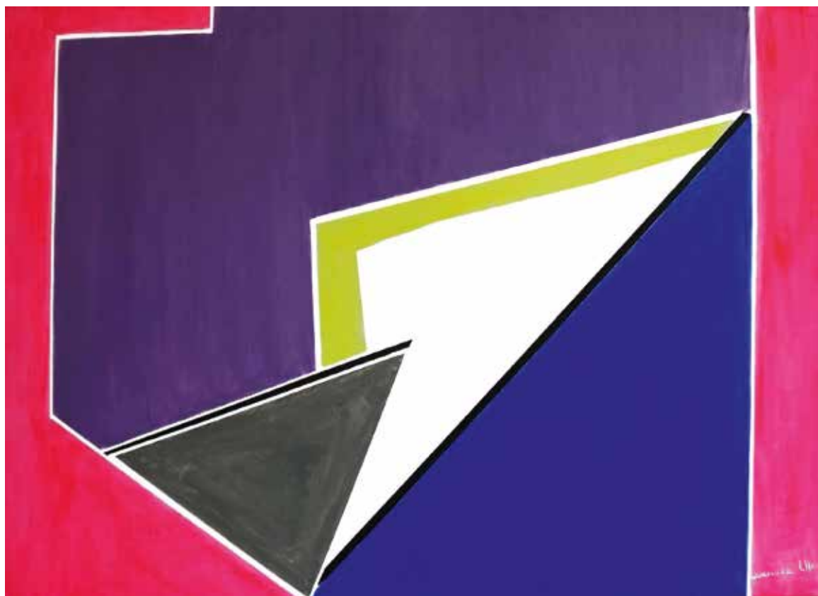
Laurence Lher «Fus – éclair», 2017 – acrylique, 60×81 cm