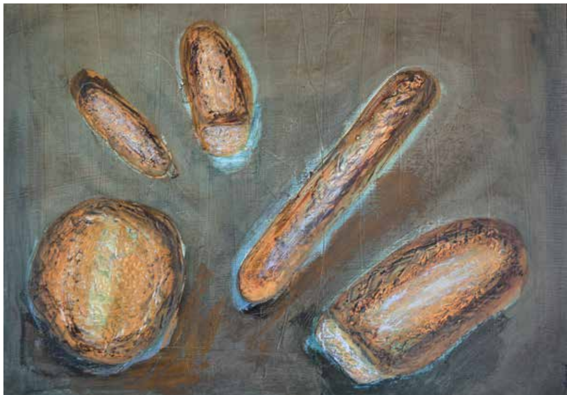
Anne-Marie Delpierre «Partage», 2016 – acrylique/matière organique, 60×80 cm