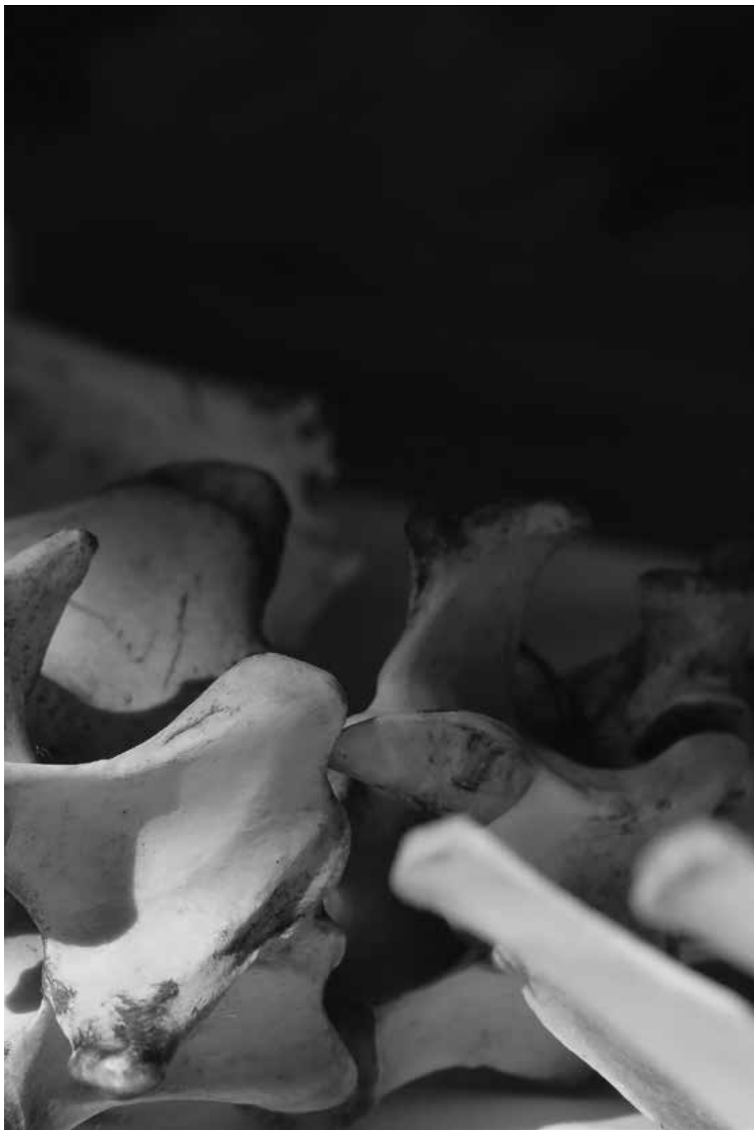
Kathryn Hart «Bones 2», 2018 – photographie, 91 × 61 cm