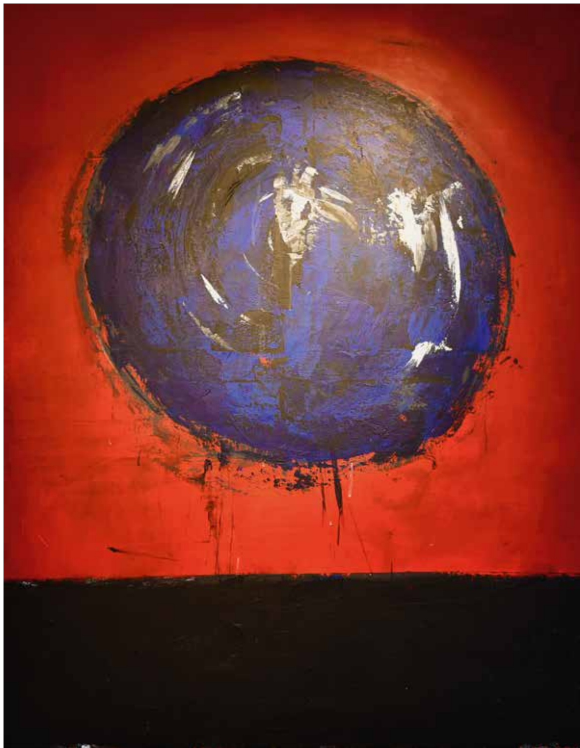
Françoise Spiess « Les pleurs de l'invisible », 2018 – acrylique, 150 × 110