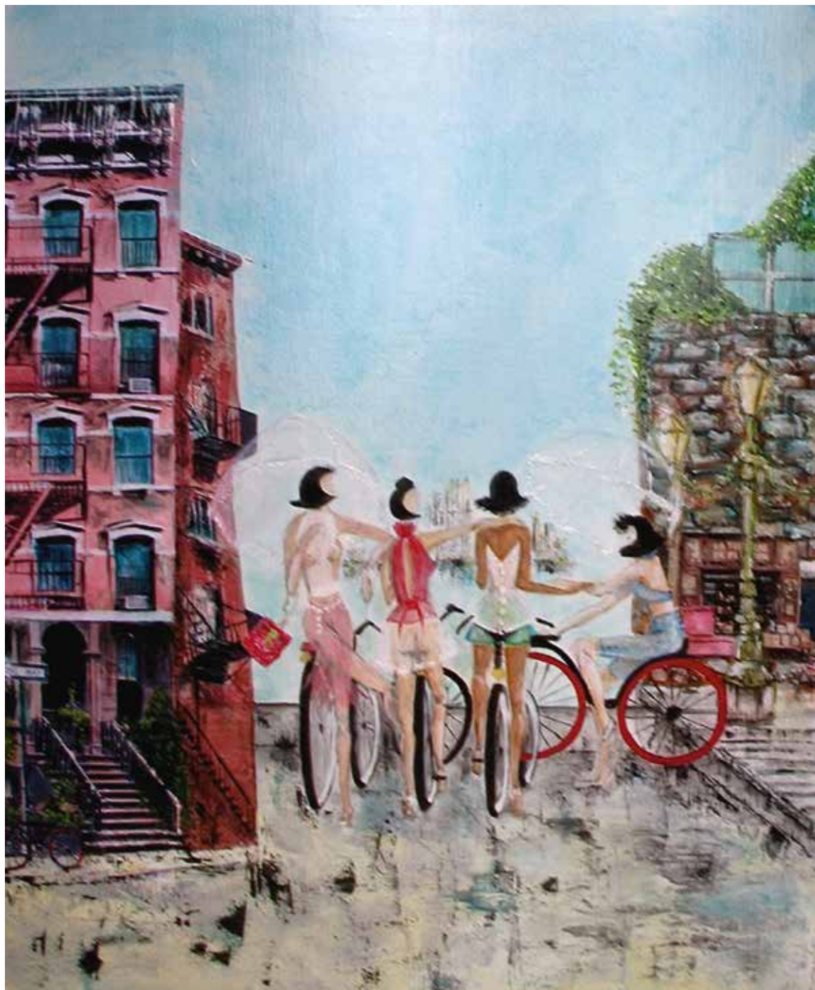
Frédérique Lombard Morel «Red Bikes», 2012 – acrylique/collages, 100 × 82 cm