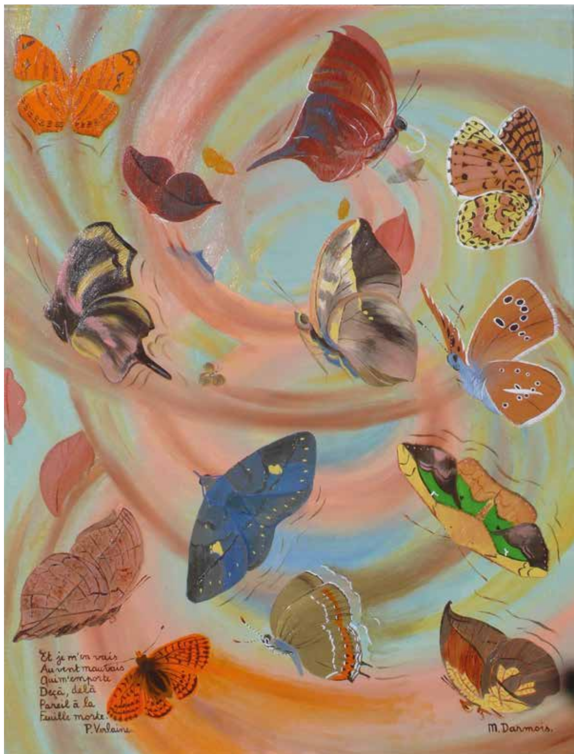
Mireille Darmois «Chanson d'automne», 2017 – huile, 65×50 cm