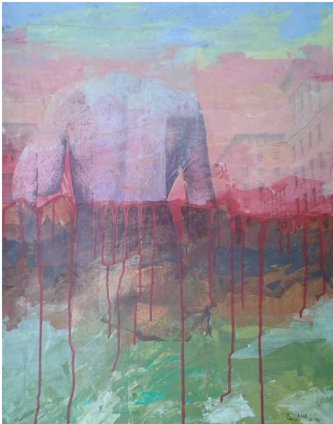
Maurizio Diana «Horizons», 2014 – huile sur collage/toile, 70×50 cm