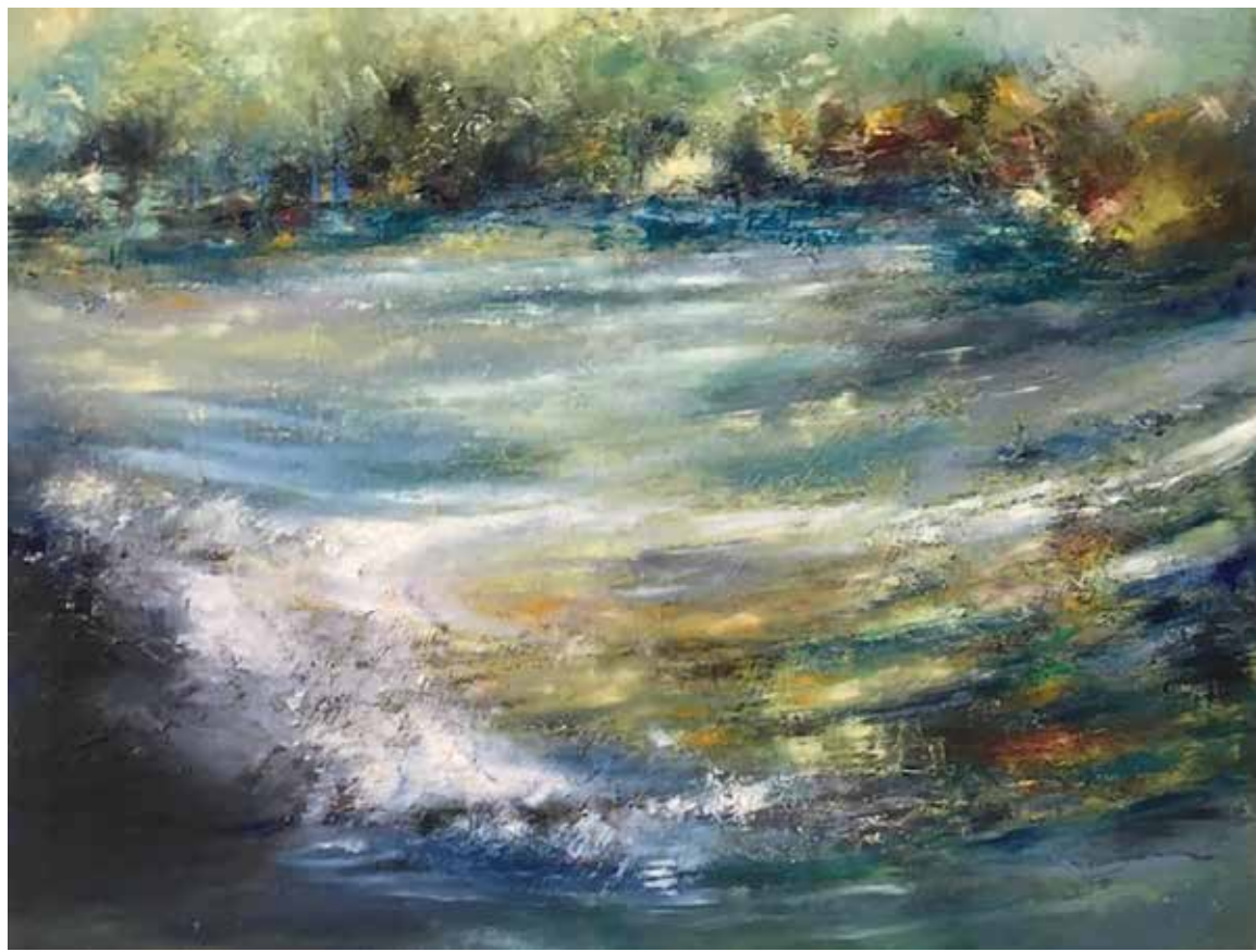
Odile Weidig « L'eau qui coule », 2018 – huile, 80 x 100 cm