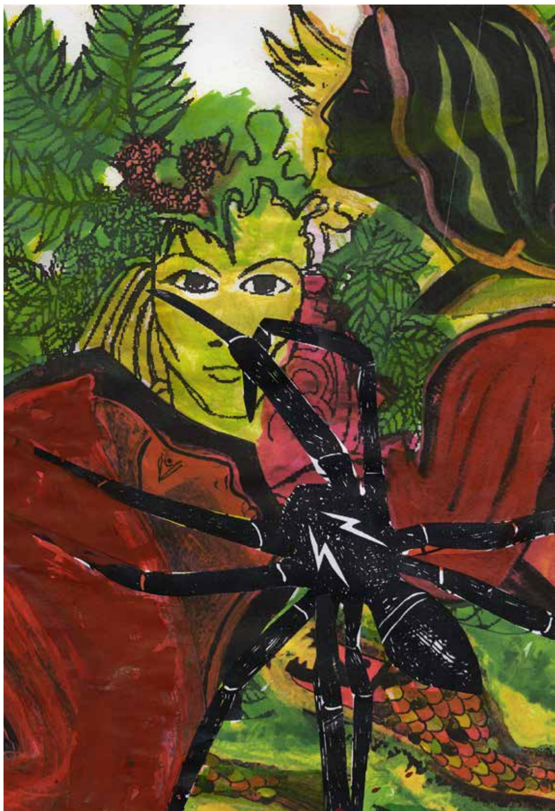
Irmgard Authaler «Phobie des araignées», 2018 - aquarelle/collage, 30×20 cm