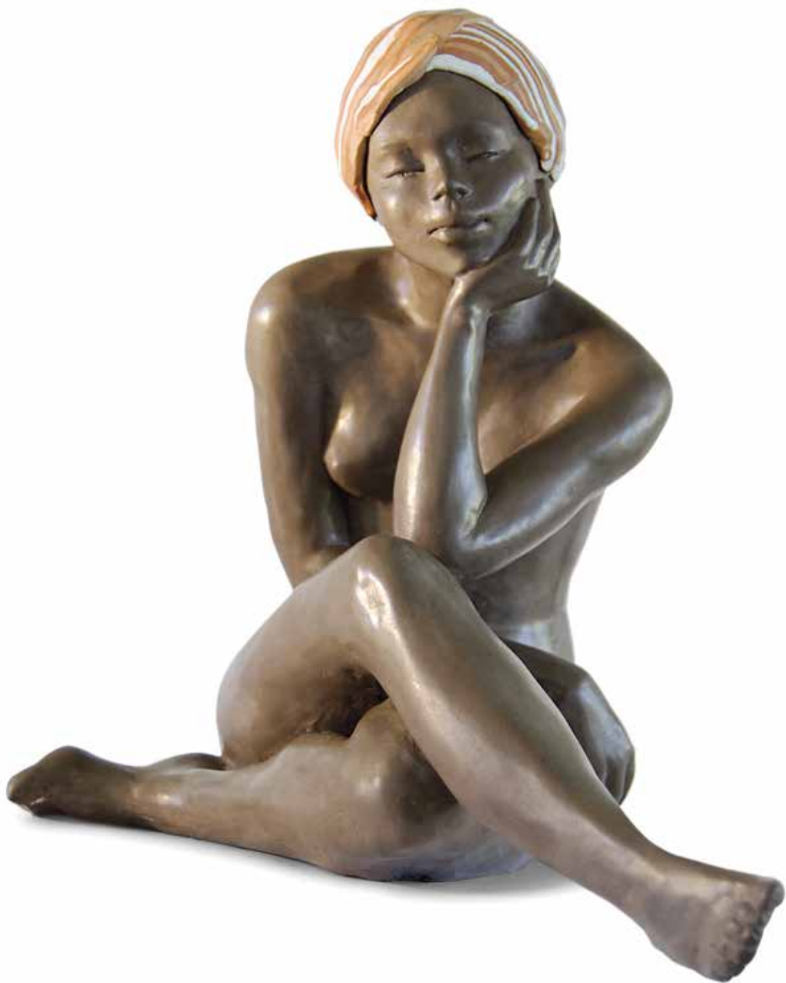
Marina Pescatori «Karoline», 2007 – sculpture/terre cuite, 29×35×21 cm