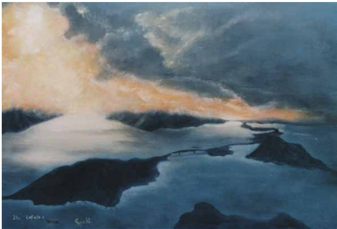
Astrid Specht «Îles Lofoten», 2003/2004 – huile, 60×81 cm