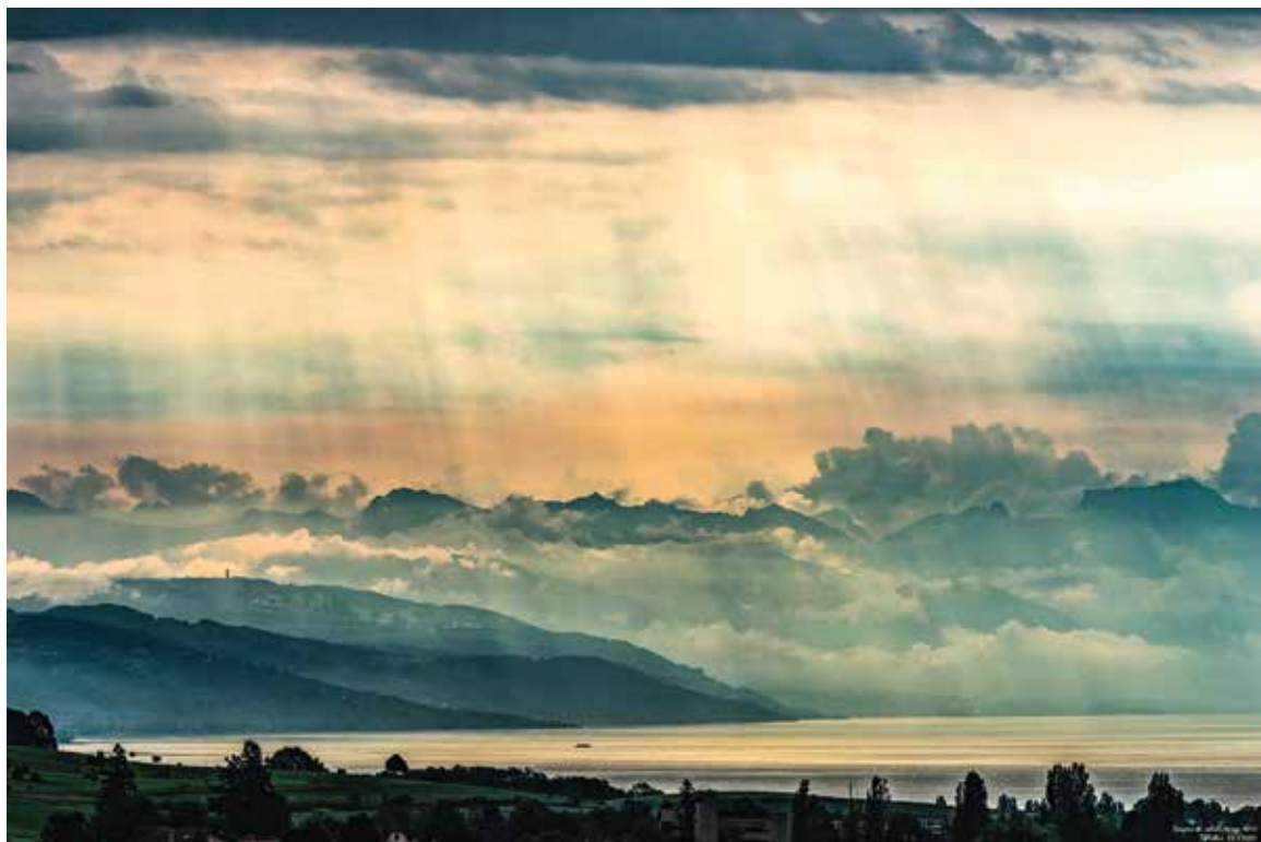
Jean-Daniel Pellet « Rayons de soleil dans le lac », 2017 photo sur papier d'art Hahnemühle et alu dibond, sur cadre caisse américaine, 40×60 cm